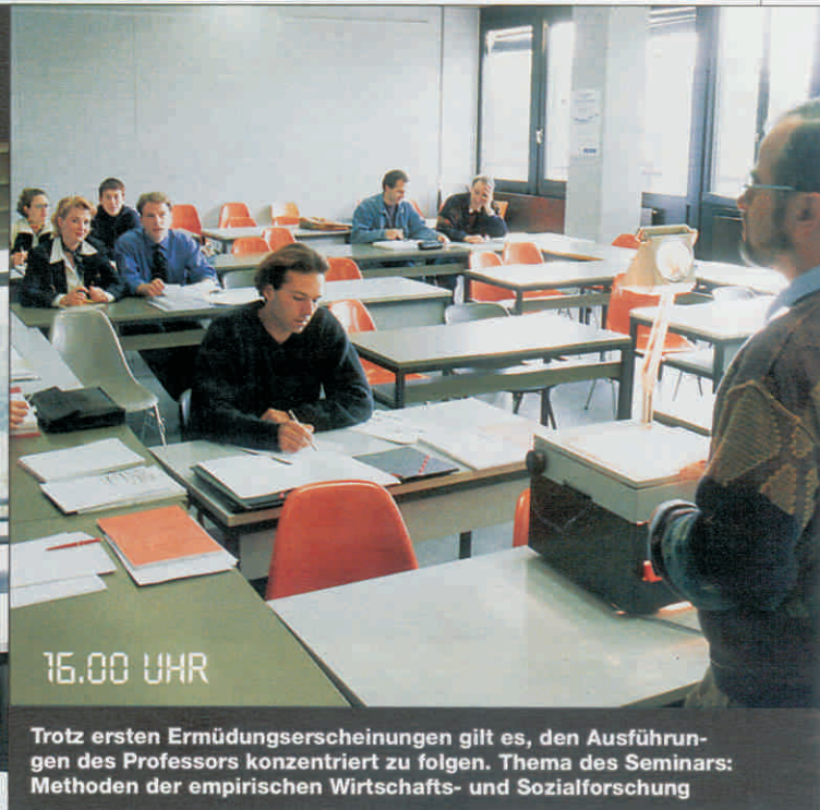
Trotz ersten Ermüdungserscheinungen gilt es, den Ausführungen des Professors konzentriert zu folgen. Thema des Seminars: Methoden der empirischen Wirtschafts- und Sozialforschung